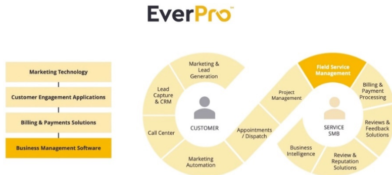
Иллюстрация 2. Набор решений EverPro