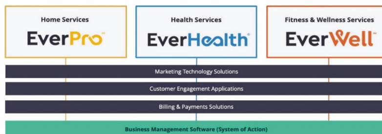
Иллюстрация 1. Наборы решений компании

Решения компании. Компания предоставляет три основных решения на рынке – EverPro, EverHealth и EverWell.