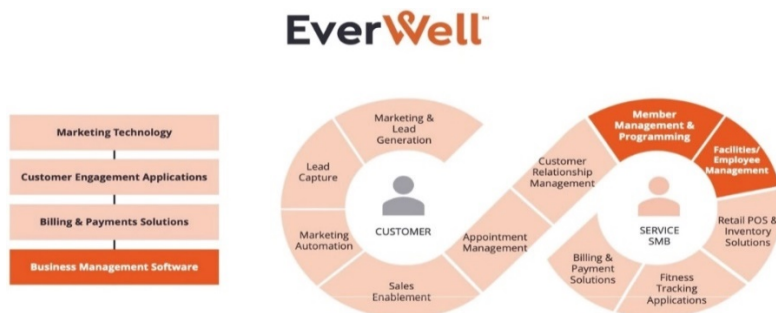
Иллюстрация 4. Набор решений EverWell