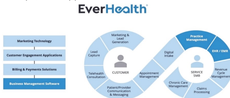
Иллюстрация 3. Набор решений EverHealth